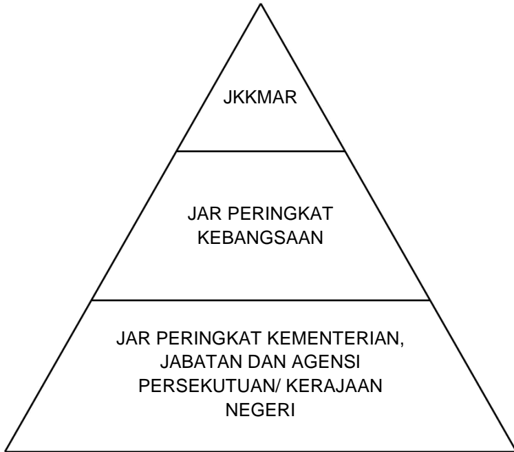
Rajah 1: Hubung Kait Peranan JKKMAR, JAR Peringkat Kebangsaan dan JAR Peringkat Kementerian, Jabatan dan Agensi Persekutuan/ Kerajaan Negeri